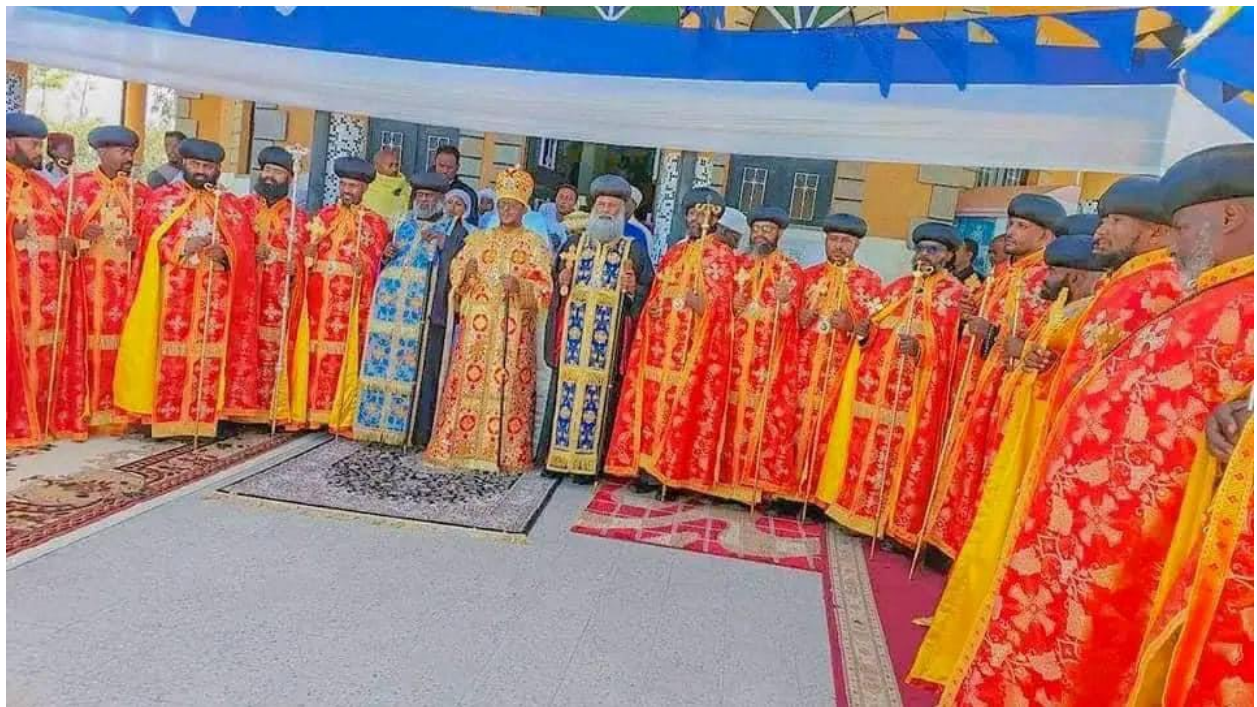
ምስል 1: በሕገ ወጥ ሹመት የተሳተፉ ሊቃነ ጳጳሳትና ተጿሚዎች 26 መነሳት

የኢትዮጵያ ኦርቶዶክስ ተዋሕዶ ቤተክርስቲያን ቅዱስ ሲኖዶስ በጥር 15 ቀን 2015 ዓ/ም ድርጊት አስመልክቶ በሰጠው መግለጫ በሀገር ውስጥ እና ውጪ ያሉ ሊቃነ ጳጳሳት በአስቸኳይ ወደ መንበረ ፓትሪያርክ እንዲመጡ፤ መንግሥት ከስተቱ በሀገር ላይ የሚያስከትለውን ጉዳት ተመልክቶ በጉዳዩ ላይ ሕጋዊ ኅላጊነቱን እንዲወጣ፤ ምእምናን ቤተክርስቲያንን ከመቸውም በላይ በንቃት፣ በሐሳብና በጸሎት እንዲጠብቁ መግለጫን አስተላልፏል [2]። ይህን ተከትሎ የተለያዩ የቤተክርስቲያን መዋቅር ውስጥ የሚገኙ አካላት በጉዳዩ ዙሪያ ያላቸውን ምልክታና አቋማቸውን ገልጸዋል።