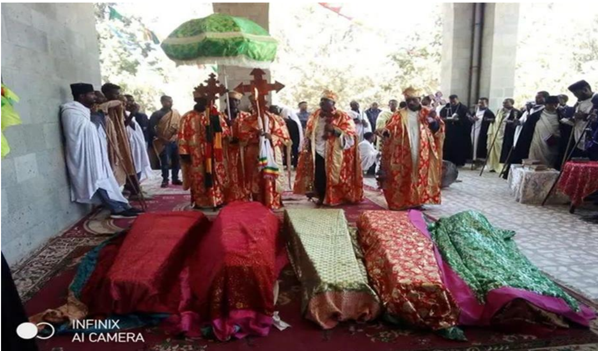
ምስል 3፡ በሻሸመኔ ጥር 27/2015 ዓ.ም ከመንግስት የጸጥታ አካላት በተተኮሰ ጥይትና ሕገወጡ ቡድን ባደራጃቸው ግለሰቦች ተደብድበው የተገደሉ ምእመናን የፍታት ጸሎት